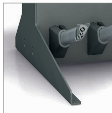
Standfuß optional erhältlich