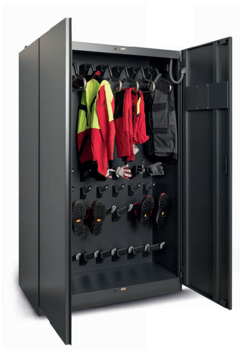
Trocknungsschränke speedDry (4er/6er/8er)