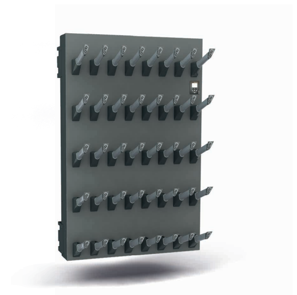
Schuhtrockner speedDry (10/15/20 Paar)