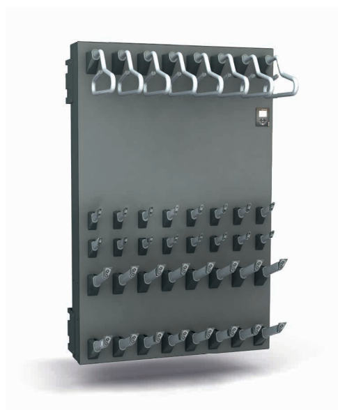
Universal Trockner speedDry (4er/6er/8er)